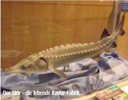
Der Stör - die lebende Kaviar-Fabrik