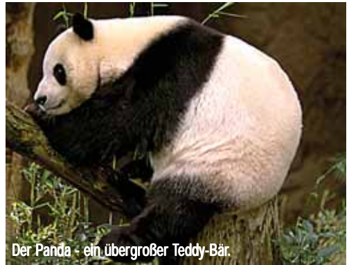
Der Panda - ein übergroßer Teddy-Bär.

Der Kiwi ist ein flugunfähiger Vogel, der aussieht wie eine... Kiwi. Er hat einen braunen runden Wuschelkörper, einen langen dünnen Schnabel und überproportional starke Beine. Wenn Kiwis Eier legen, zeigt sich der Kiwi-Vater als sehr aktiv; er baut das Nest und brütet die Eier aus. Er lebt in Neuseeland. Neuseeland ist eine Insel, und der Kiwi war dort perfekt an die Umgebung angepasst. Aufgrund seiner Flugunfähigkeit konnte er leider weder den Hunden noch den Ratten entweichen, welche die Europäer in Neuseeland eingeschleppt haben. Mittlerweile ist er als gefährdet eingestuft.