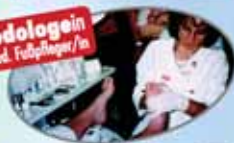
Podologin (med. Fußpflegerin)