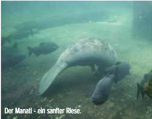
Der Manati - ein sanfter Riese.

Wer in Europa wohnt, hat oft das Gefühl, dass Tiere nur in der Ferne bedroht sind. Man denkt meist sofort an Afrika oder an den Regenwald im Allgemeinen. Europa ist alt, sehr alt, und vieles das Aussterben konnte, ist bereits ausgestorben. Aber es gibt auch hier Tiere, die bald vielleicht nicht mehr sein werden. Der Stör, dessen Verbreitungsgebiet ganz Europa ist, dient als Beispiel dafür. Seine Eier werden als Kaviar bezeichnet, gelten als Delikatesse und wurden übermäßig viel gesammelt. Problem: Ohne Stör-eier gibt es keinen Nachwuchs mehr. Der Stör ist ein beeindruckender Fisch: Er wird bis zu 2 m lang und wiegt bis zu 300 kg! Er hat harte Platten auf dem Rücken wie eine Schildkröte und ist grau-braun gefärbt.