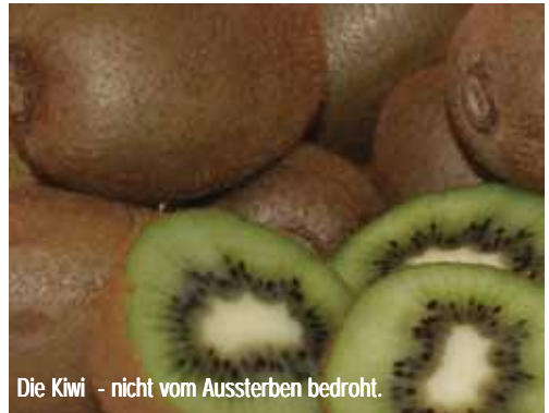
Die Kiwi - nicht vom Aussterben bedroht.