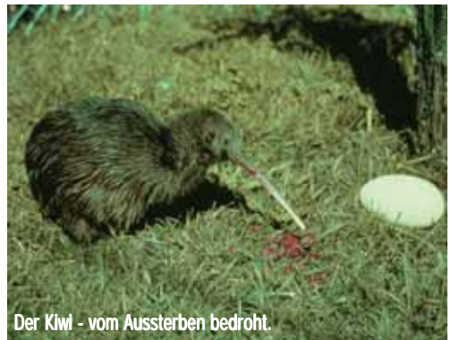
Der Kiwi - vom Aussterben bedroht.