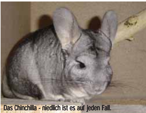
Das Chinchilla - niedlich ist es auf jeden Fall.

Sie gelten als beliebtes Haustier. In der Wildnis gibt es allerdings nicht mehr viele, die Population wird auf circa 10.000 Tiere geschätzt. Früher wurden sie für ihr weiches Fell und das Fleisch gejagt. Für einen einzigen Pelzmantel mussten weit über hundert Tiere sterben! Ihre größte Bedrohung heutzutage ist, dass sie ihre Habitate verlieren. Es wird davon ausgegangen, dass Chinchillas in naher Zukunft in der Wildnis aussterben werden.